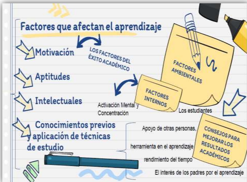
Imagen N a 1 Factores que afectan el aprendizaje vs proceso evaluativo