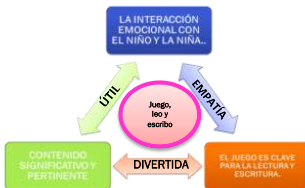
Figura N° 01. Modelo Didáctico Innovador para la Lectura y Escritura.

En este sentido, se requiere un cambio profundo en el pensamiento y accionar de los docentes del nivel de educación inicial, a través de acciones efectivas que contribuyan a fomentar la lectura y escritura como hábito, es decir, transformar el hábito de leer en un interesante pasatiempo, en lugar de una obligación, lo que contribuye a mejorar una serie de capacidades cognitivas y a prepararlos para su vida adulta.